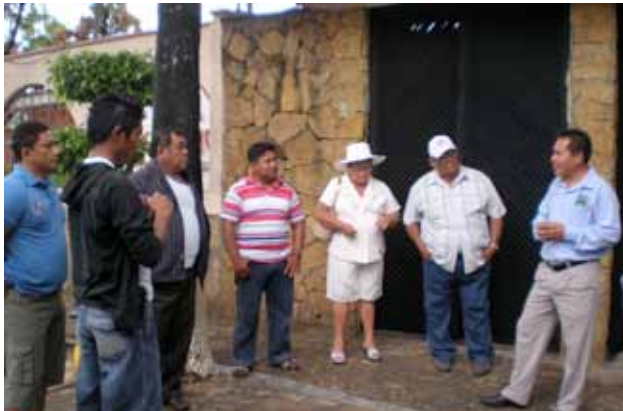
Fig. 1. Prestador de servicios de Chiapas conversando con los cooperativistas de Isla Aguada / Chiapas local service provider talking with Isla Aguada stakeholders.

El GoM LME trabaja en estrecha colaboración con el ANP Laguna de Términos para fomentar la participación activa de las comunidades en la búsqueda y diseño de actividades económicas alternativas. Una de estas alternativas es el ecoturismo que se ha llevado a cabo en la Laguna de Términos en los últimos cinco años, en especial en la comunidad de Isla Aguada, pero de manera irregular y sin una adecuada planificación.