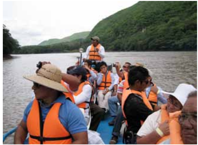
Fig. 3. Recorrido por el Río Grijalva. Grijalva River tour.

During lunch different local authorities talked with Isla Aguada stakeholders