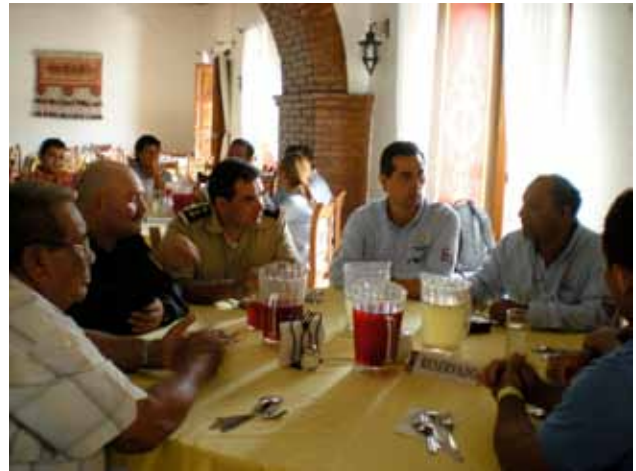
Fig. 4. Comida con las autoridades locales, los directores de las ANP y los cooperativistas. Lunch with local authorities, directors of the NPAs and stakeholders.

los turistas y 5) no importa que tan lejos pueda esta un área de otra, ambas están conectadas de diferentes maneras y lo que se haga en una puede afectar a la otra.