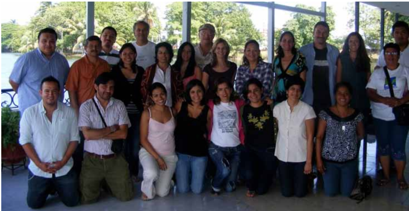
Grupo de trabajo de manatí, Foto: N. Castelblanco / Manatee working group, Photo: N. Castelblanco.

Un problema detectado durante la elaboración del PACE fue la falta de protocolos estandarizados para la toma y colecta de datos relacionados al manatí. En este sentido, durante los días del 25 al 28 de octubre se llevó a cabo en Villahermosa, Tabasco, una reunión nacional con expertos y autoridades relacionadas con la conservación del manatí en México. El Objetivo Principal de la reunión de trabajo fue generar los protocolos nacionales consensuados que propicien el mejoramiento de la atención temprana a manatíes en situación de emergencia, a fin de facilitar su pronta recuperación y reintroducción a su medio y/o cuidado permanente, así como coadyuvar en la adecuada recuperación de cadáveres que genere información biológica y de manejo estandarizado a nivel nacional que nutran una base nacional de información.