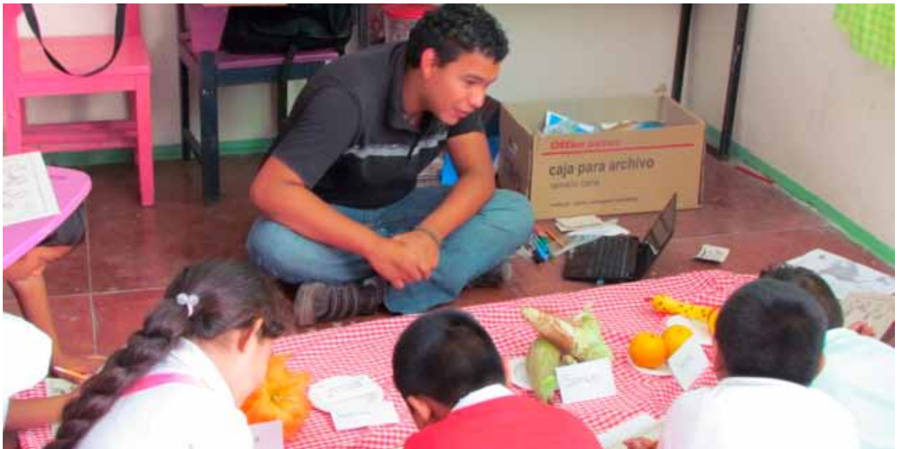
Niños asociando los conceptos de dietas con la importancia ecológica de las aves.

All educational activities were given by: researchers and students of MU-OH, UAT, the Autonomous University of Campeche, the Techno-