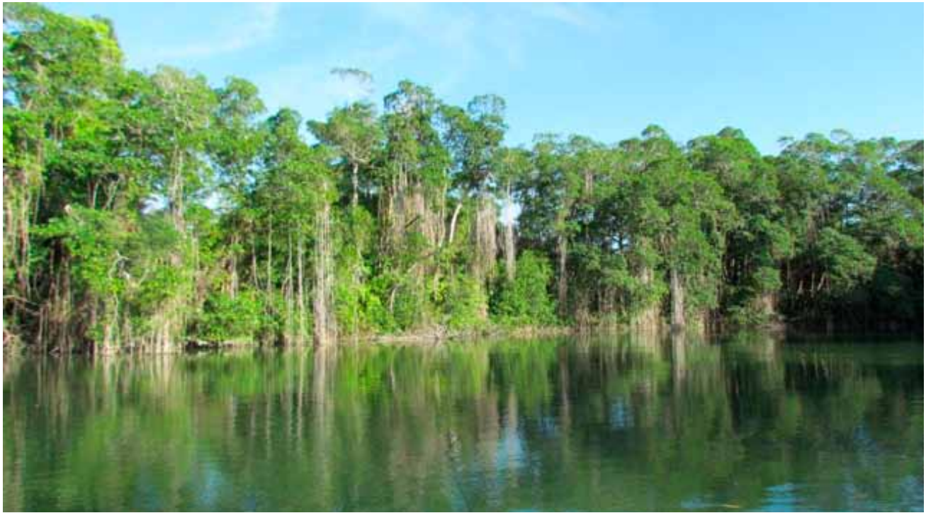
El manglar un ejemplo de ecosistema ripario con prioridad de conservación.