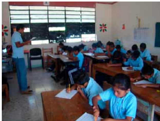
Niños respondiendo las encuestas de conocimientos y actitudes hacia los ecosistemas riparios.

Our four focal topics of this workshop were imparted in interactive independent stations where children received brief explanations, didactical material (paper, crayons, pencils, color pencils, pictures, labyrinth games, puzzles, posters) and were asked to play, discuss, answer specific questions and do craftwork. By doing these activities, students associated concepts and ecological roles at each station and between