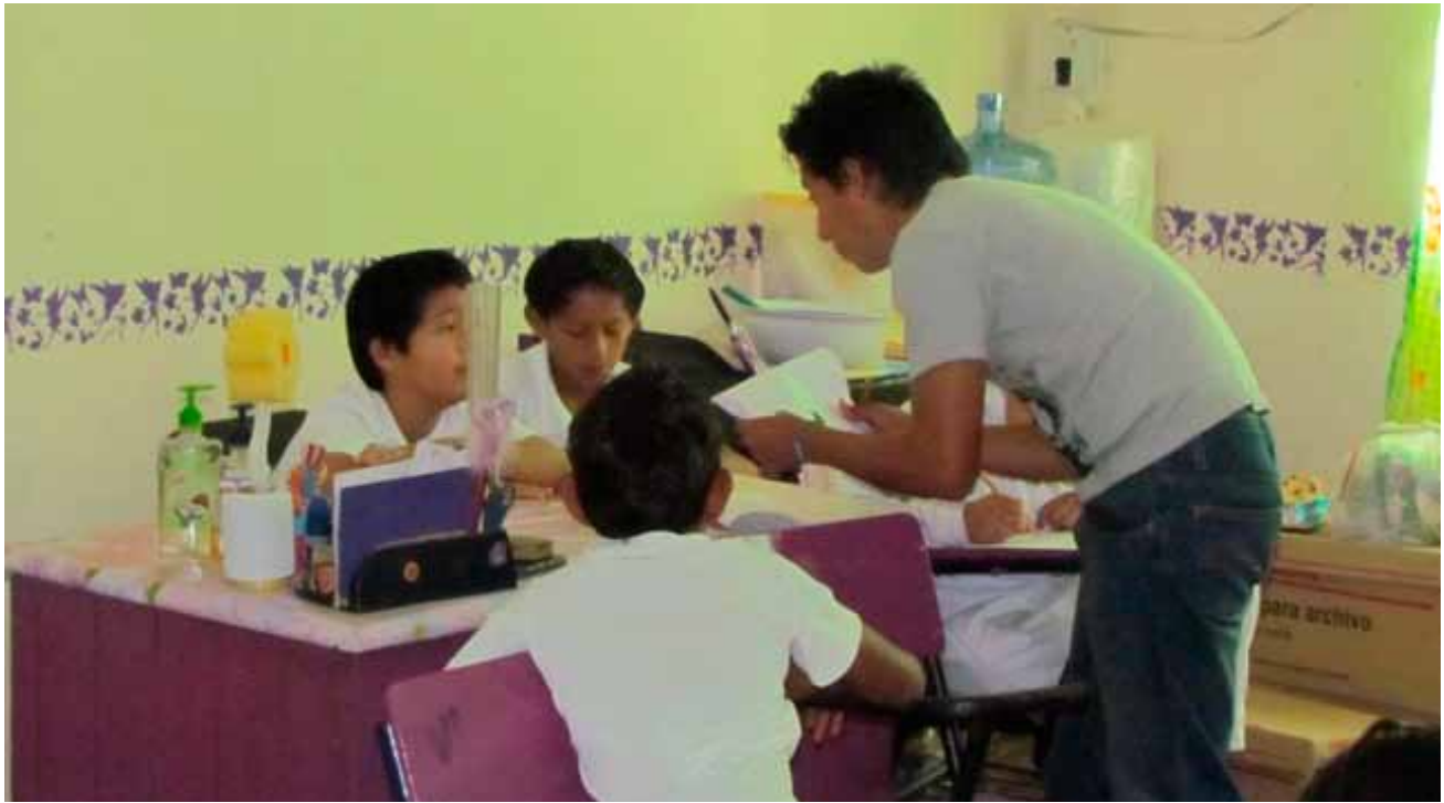
Niños trabajando y discutiendo los temas de aves riparias residentes y migratorias.

ños de cuarto año de primaria de cuatro escuelas del sur de Campeche. El programa de actividades consistió en un taller interactivo, pláticas y encuestas de conocimientos y apreciación de las especies riparias (principalmente aves).