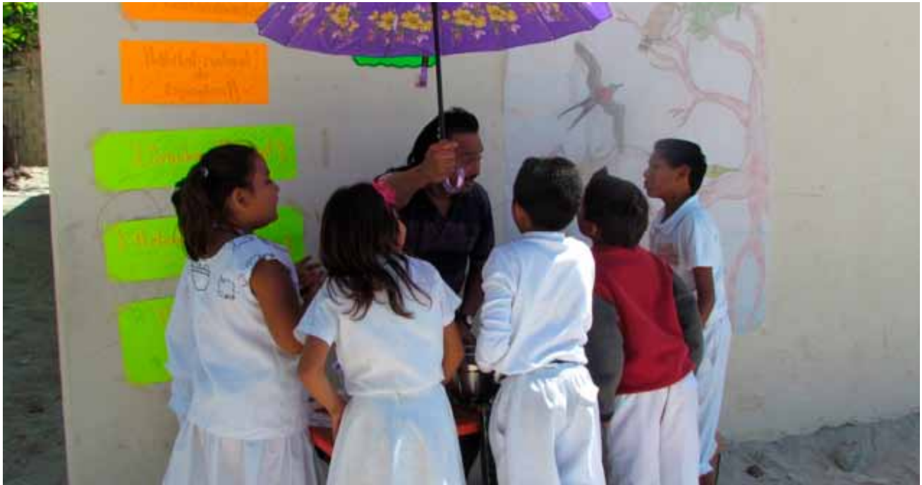
El manglar provee de hábitats y microhábitats con condiciones favorables para muchas especies.